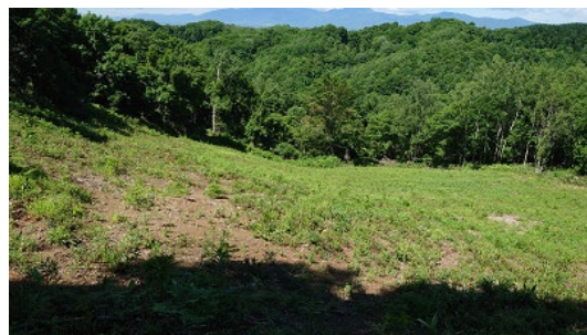
北海道（千歳林業社有林）