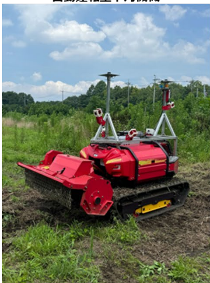
自動運転型下刈り機械