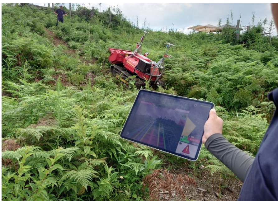
傾斜約 25 度を登坂している自動運転型下刈機械

遠隔地では車両の四方についたカメラ映像や地図に配置された機体の位置情報、四方のうちの前カメラに合成された自動運転走行ルート情報などを複合的に目視で確認することで、機体の状態をリアルタイムに把握します。傾斜角や GNSS 電波の精度等、機体の安全性に影響を及ぼす情報についても同様にモニタリングし、危険がある場合は監視者側で遠隔操縦への切り替えによる操作が可能です。また、自動運転ルートの設定、車両の遠隔監視はいずれもタブレット端末で動作する専用アプリケーションのみで操作可能です。遠隔監視、操作時の通信については 4G/LTE 通信に加えて衛星通信「Starlink」も使用できるため、電波の入りにくい環境下でも作業を行うことが可能です。