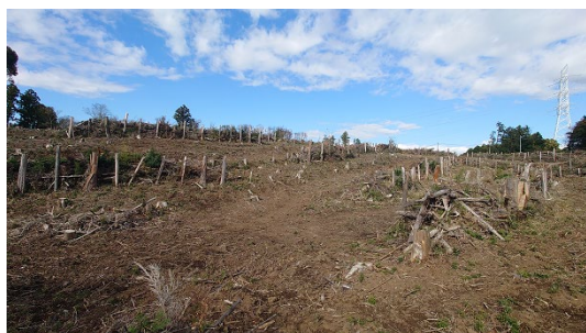
千葉県（ドコモ君津の森）