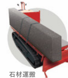
石材運搬イメージ