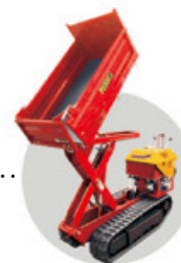
リフトとダンプが可能 S9・S6共通