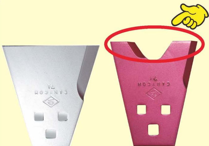
従来刈刃 ひろさき